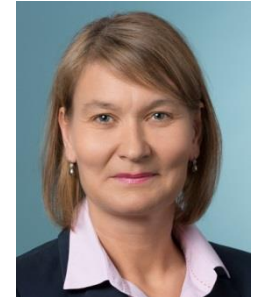
V. Resta SF BE