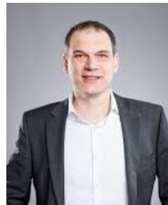
S. Meunier baselarea.swiss