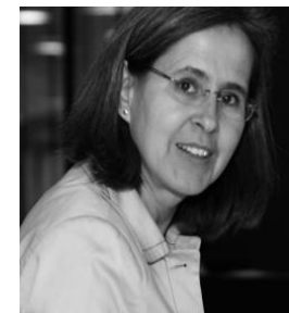
A. Martinecz SF Kt. ZH