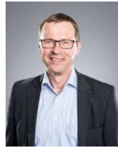
R. Dümpelmann baselarea.swiss