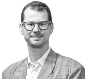
L. Ambrosini Fondazione Agire