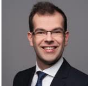
Ch. Blum RIS Ost