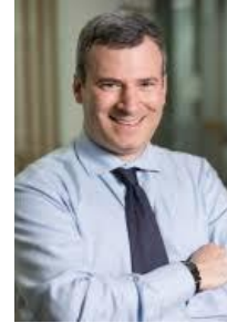
P. Lantini platinn